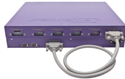
EPS-C2 连接到 Summit X440